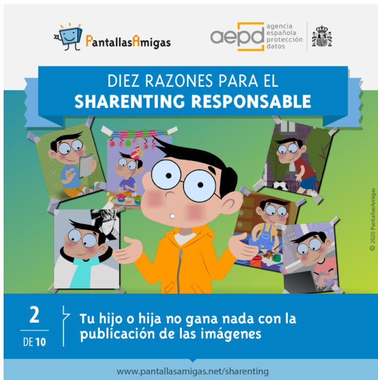
Imagen de la campaña de PantallasAmigas.

En este tema hay que decir que desde hace unos meses se han desarrollado campañas en contra del sharenting . Así, por ejemplo La Agencia Española de Protección de Datos realizó en julio de 2020 una campaña para concienciar sobre el uso de imágenes de menores de edad en internet. La campaña de sensibilización la realizó junto a PantallasAmigas , una asociación que fomenta el uso saludable de las tecnologías de la información y comunicación. Bajo el título « Diez razones para el sharenting responsable » buscaba la reflexión de padres y madres antes de compartir imágenes de sus hijos e hijas en la Red. Pueden ver la campaña AQUÍ .